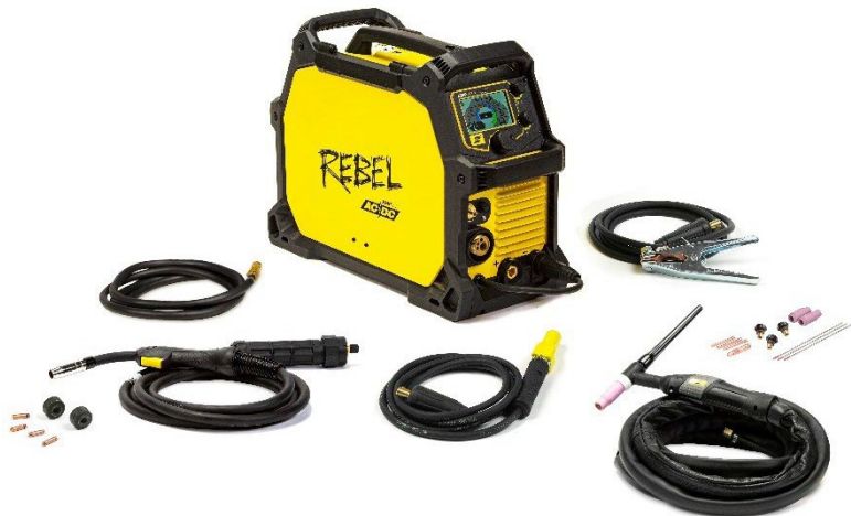
Rebel EMP 205ic AC/DC ja lisävarusteet.

Teimme mahdottomasta mahdollista kaikkien aikojen ensimmäisellä kannettavalla kaikkien menetelmien laitteella, joka sisältää MIG-, täytelanka-, puikko, DC TIG ja nyt AC TIG -kapasiteetit, joten – aivan oikein – sillä voi TIG-hitsata alumiinia. Se on AITO kaiken kattava hitsausjärjestelmä, joka takaa luokkansa parhaan suorituskyvyn jokaiselle prosessille nykymarkkinoiden helpoiten kannettavana, kestävimpanä, minne vain kuljetettavana ja mitä tahansa hitsaavana alan pakettina.